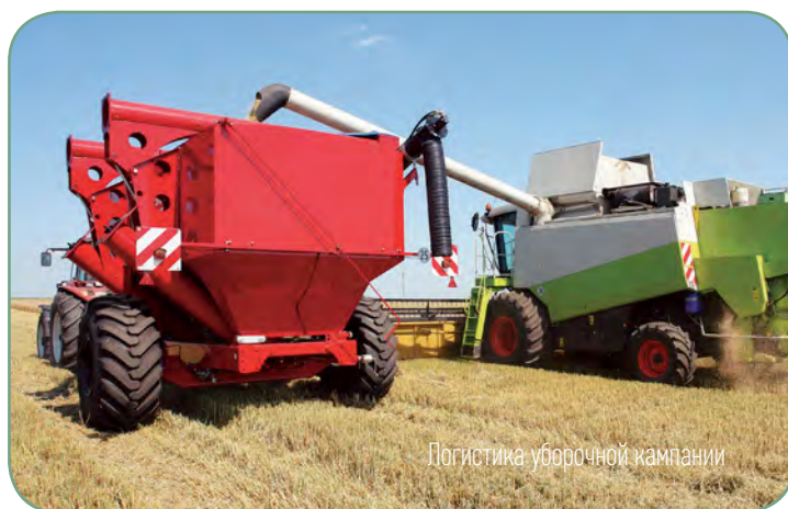
Логистика уборочной кампании

Во время уборки: следуя рядом с комбайном, накопитель-перегрузчик UW 200 принимает в себя зерно прямо на ходу, а затем на краю поля в считанные минуты перегружает его в кузов грузовика.