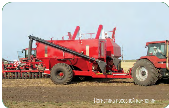
Логистика посевной кампании

При посеве: в двухсекционную емкость UW 200 загружается до 20 м 3 семян и гранулированных удобрений. Большой объем емкости и высокая скорость перегрузки посевного материала в бункер сеялки позволяют увеличить производительность посевной техники на 20 %.