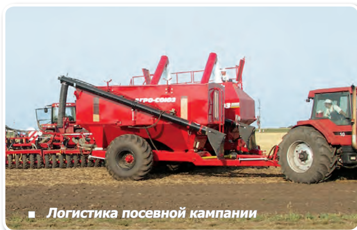
■ Логистика посевной кампании

При посеве: в двухсекционную емкость UW 200 загружается до 20 м 3 семян и гранулированных удобрений. Большой объем емкости и высокая скорость перегрузки посевного материала в бункер сеялки позволяют увеличить производительность посевной техники на 20 %.