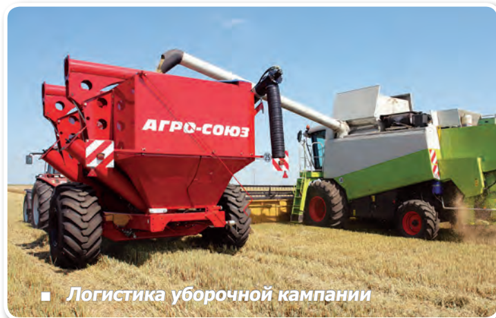
■ Логистика уборочной кампании

Во время уборки: следуя рядом с комбайном, накопитель-перегрузчик UW 200 принимает в себя зерно прямо на ходу, а затем на краю поля в считанные минуты перегружает его в кузов грузовика.